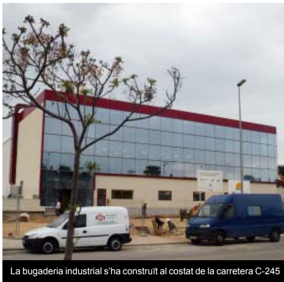
La bugaderia industrial s'ha construït al costat de la carretera C-245