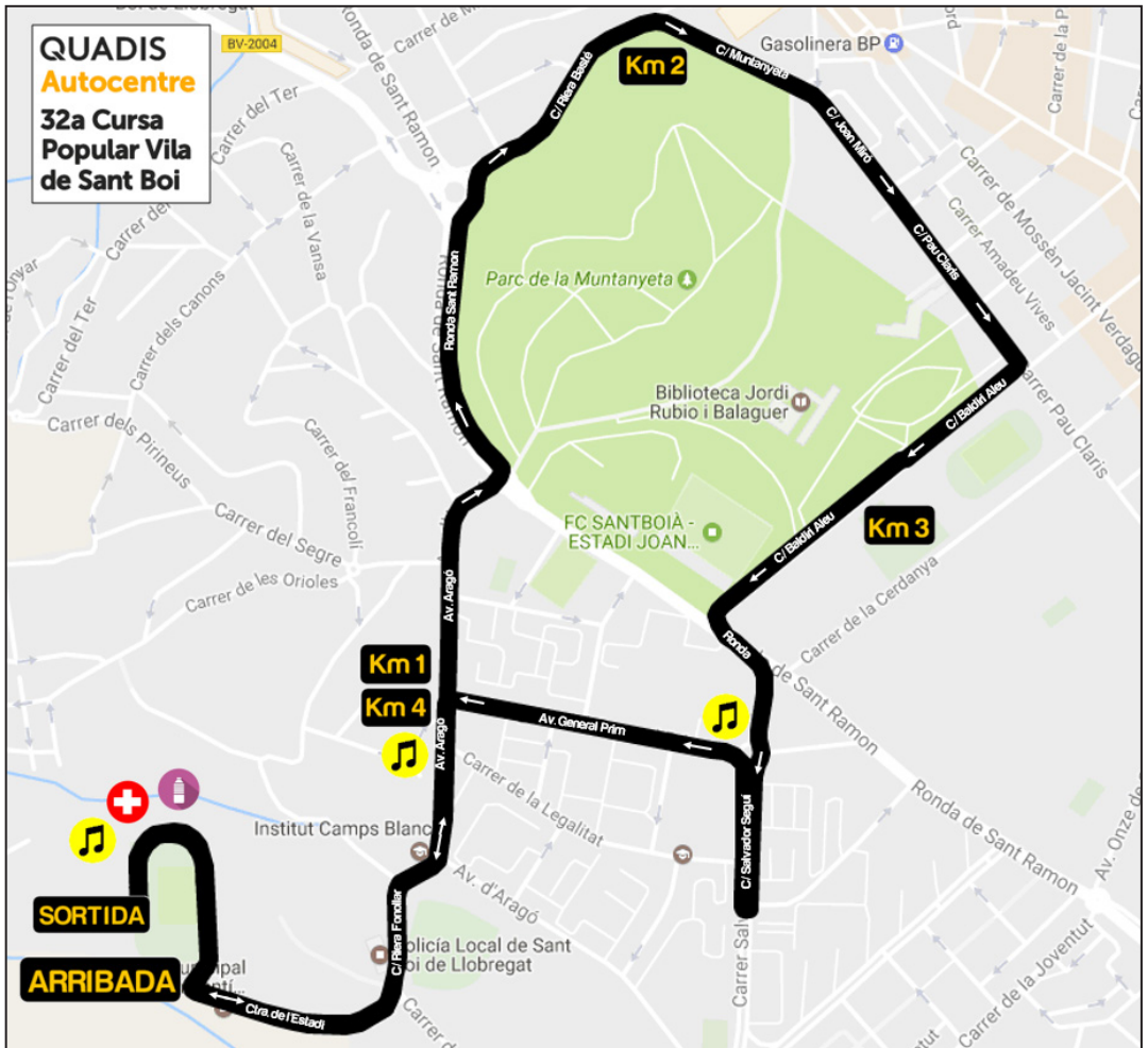
Recorregut Open popular de 5 Km