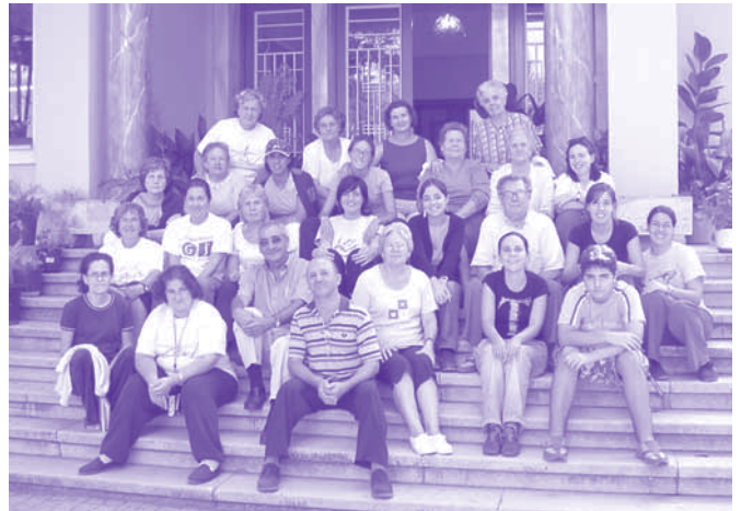
Els voluntaris i les voluntàries durant curs de formació de professorat al setembre del 2004.

Aprofitant aquesta diversitat cultural que presenta el seu barri i per fomentar un espai de tolerància, de conversa entre amics i amigues, pròximament començaran una tertúlia multicultural, on els i les participants –persones nascudes a Catalunya, al sud d'Espanya, d'ètnia gitana o del Magrib- podran trobar-se, intercanviar i explicar costums, gastronomia, i maneres d'entendre i viure la vida.