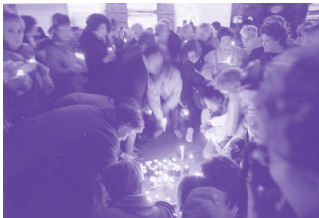
Encesa d'espelmes. Plaça de l'Ajuntament. Novembre 2003

Aquesta advocada comenta que la nova llei aporta "major claredat en les mesures de protecció que pot adoptar el jutge o jutgessa i, per exemple, es podrà acordar la