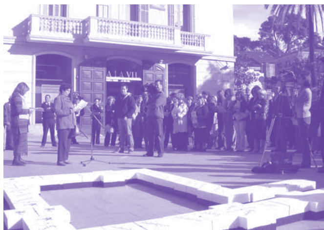
Lectura del manifest contra la violència de gènere per part de l'alcaldessa. Novembre 2003

La nova llei serà una de les més avançades d'Europa per eradicar la violència contra les dones