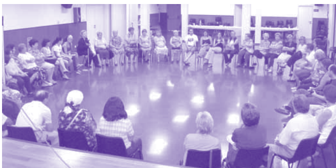
La darrera assemblea de l'Associació celebrada el juny del 2004

D'altra banda, en els darrers anys, s'ha incrementat molt la diversitat ètnica del barri amb l'arribada dels i de les immigrants d'altres països, sobretot del Magrib. Davant aquestes noves necessitats també organitzen cursos d'espanyol per a immigrants i d'àrab per poder alfabetitzar en la seva pròpia llengua a les persones que no saben llegir ni escriure.