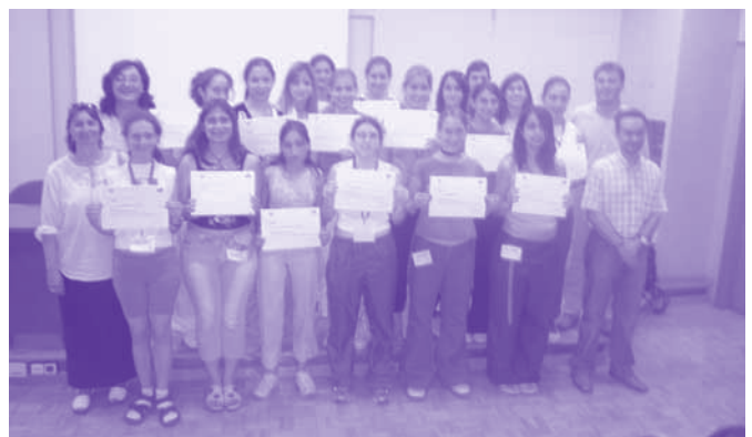
Noies assistents a l'estiu del Programa dona de l'UPC. Juny 2004

La UPC va organitzar el passat mes de juny unes jornades a Terrassa en el marc de l'estiu del Programa dona, amb l'objectiu d'acostar les noves tecnologies a les noies. Es tracta de relacionar el món de la tecnologia amb els interessos acadèmics i professionals de la dona, per aconseguir la igualtat d'oportunitats en l'elecció professional, el desenvolupament i la inserció tecnològica. Tal com comenta Núria Salam, professora de Les Escoles del Campus de Terrassa de la UPC, moltes de les noies que participen en aquestes jornades després es matriculen a qualsevol de les titulacions tècniques-tecnològiques i, generalment, se'n surten amb menys problemes que molts nois. Per tant es tracta d'aconseguir que la societat no desaprofiti el potencial tecnològic que poden tenir les dones. Aquest hauria de ser un dels principals objectius de les institucions educatives i dels agents socials.