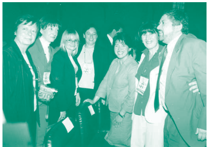
L'equip del centre de Planing en la presentació del Manual d'educació sexual a Xile, el passat mes d'octubre

Des de la seva creació aquest centre es va distingir per tenir un equip de professionals especialment ampli i qualificat. Sempre ha disposat d'especialista en ginecologia, infermeres titulades i psicosexòloga.