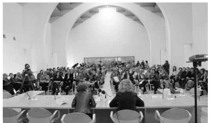
Assemblea de constitució del Consell de les Dones

El 15 de març va tenir lloc la primera reunió de la Junta amb l'acord de constituir dues comissions de treball: Violència vers les dones i accions afirmatives per assolir la igualtat d'oportunitats. Aquestes comissions ja s'han reunit i han començat a treballar.