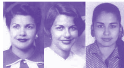
Patria, Minerva Ma. Teresa Mirabal

De tot això ens parla Júlia Álvarez a la seva novel·la En el tiempo de las mariposas (1994). Ens dona a conèixer la vida d'aquestes tres dones que van lluitar des de la clandestinitat amb el nom fals de "mariposas" per desfer-se del seu enemic: el general Trujillo. Una persona amb una vida tant miserable que creia que imposant el seu poder i fent patir a la gent seria més que ningú, sense adonar-se que no era res (o potser sí que s'adonava d'això, que no