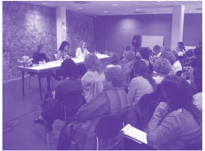
Seminari primavera 2005, impartit per DUODA

Amb aquest simbòlic i amb la seva fantasia "egocèntrica", posen en perill l'obertura i la disponibilitat de la relació amorosa de les dones, en no saber reconèixer la seva dignitat de crear i