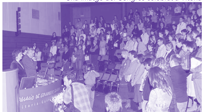
Una imatge del Congrés celebrat a Vitòria

Hi van assistir prop de 600 persones de diverses comunitats autònomes. Una representació de l'Ajuntament de Sant Boi també hi va ser present. La directora d'Emakunde, l'Institut basc de les dones, va dir que per combatre la violència necessitem potenciar l'educació per a la igualtat i reforçar el paper de les dones en la societat. Va afirmar que "todavía hay muchas mujeres que viven cautivas en sus propios hogares". "Este problema social, al que se refirió como el máximo exponente de la desigualdad, dijo, hoy en día es una de las mayores preocupaciones de la agenda política".