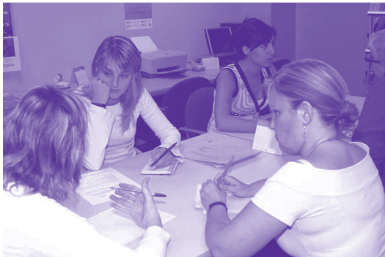
Reunió de treball al Centre de Recursos i Documentació per a les dones

Per altra banda, al llarg d'aquest any s'han fet diversos cursos sobre tecnologies de la informació i de la comunicació, el seminari sobre Història, pensament i pràctiques de les dones i tallers de risoteràpia, relaxió, com controlar l'ansietat, etc.