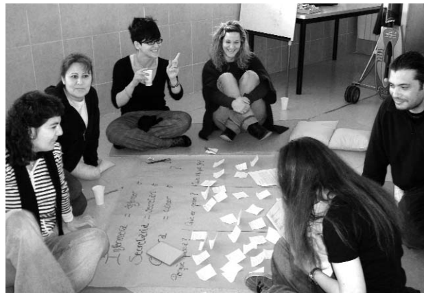
Jornada de presentació del Pla. Reunió de treball

La implementació del Pla serà revisada periòdicament per la comissió d'igualtat a partir d'un sistema d'avaluació que permeti corregir desviacions o modificar actuacions.