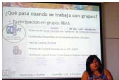
A la UJI (Castelló), en una Jornada d'Innovació Docent en l'àmbit de Materials, on va estar convidada a fer la Conferència Plenària.