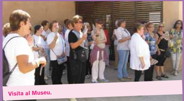
Visita al Museu.