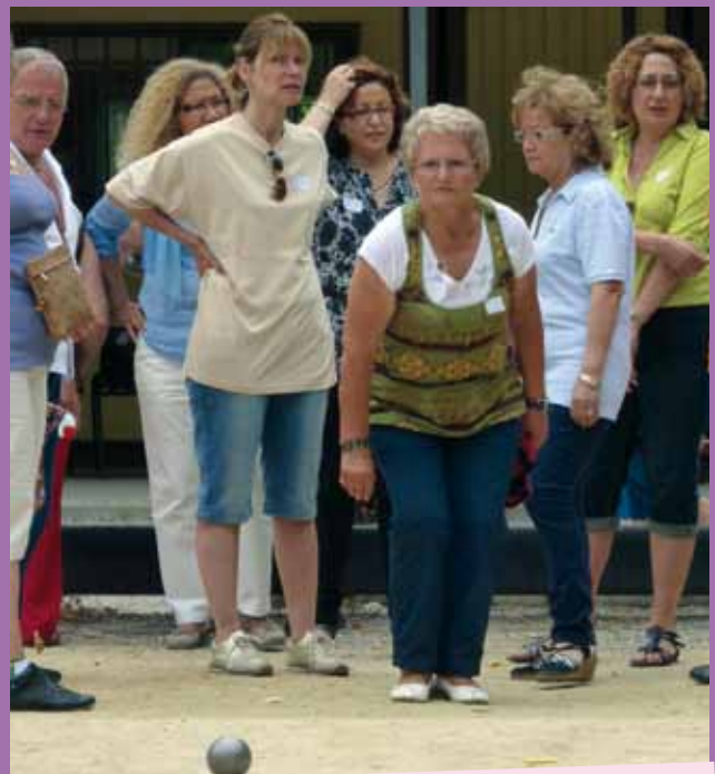
Concurs amateur de petanca dirigit per l'equip femení de la "Peña Petanca Ronda".