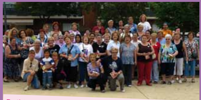
Participants a la Diada.