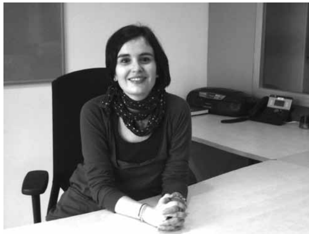
Mun tsa Vilamitjana

En canvi, l'assetjament per raó de sexe es dona quan s'atempta contra la dignitat d'una persona mitjançant la realització de conductes negatives en base al sexe i a l'adscripció social que aquest té. Alguns exemples serien la diferència salarial en una mateixa empresa per a persones que fan les mateixes tasques, però de diferent sexe o el tractament ofensiu que reben alguns treballadors homes quan realitzen feines històricament vinculades a dones, com el cas dels infermers.