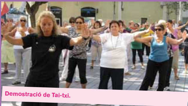
Demostració de Tai-txi.

A Sant Boi es va fer una passejada fins a la plaça de l'Ajuntament i una demostració de tai-txi amb una classe per a totes les dones que van voler participar. L'activitat es va acabar amb una visita al Museu Can Barraquer, de la nostra ciutat.