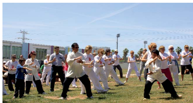
Exercicis d'exhibició. Taller de Tai-txi. 7 de juny del 2009