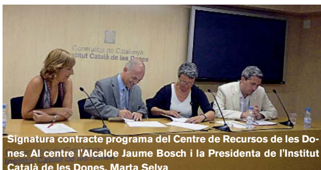
Signatura contracte programa del Centre de Recursos de les Dones. Al centre l'Alcalde Jaume Bosch i la Presidenta de l'Institut Català de les Dones, Marta Selva

D'entre totes les activitats organitzades destaca la primera passejada que va tenir una gran acceptació ciutadana amb molta participació. Una aposta pel benestar i la qualitat de vida a través del foment de la pràctica esportiva de les dones com un element de salut.