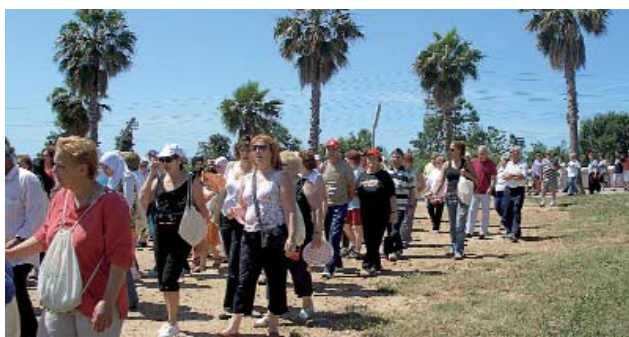
Primera Passejada per la Salut de les Dones 2009. 7 de juny 2009