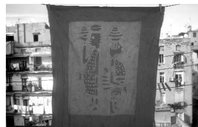
Exposició sobre la SIDA. A l'Olivera del 30 de novembre al 14 de desembre

És veritat que hi ha hagut avenços en la prevenció de la SIDA i en la millora de la qualitat de vida de les persones afectades,