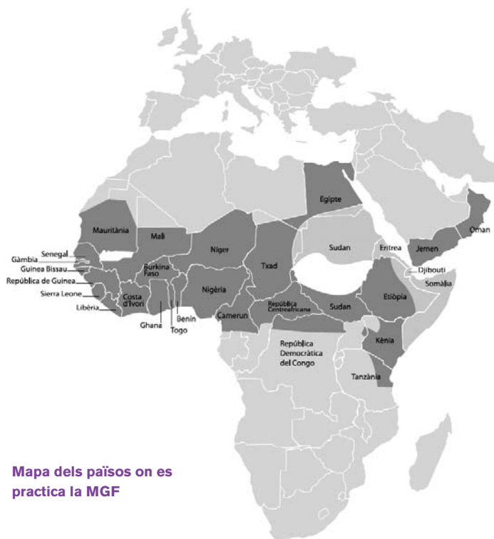
Mapa dels països on es practica la MGF