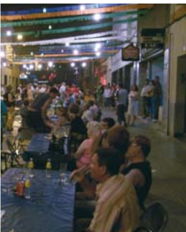
La Unión Extremeña celebra la revetlla de Sant Joan al carrer de Mossèn Cinto Verdaguer