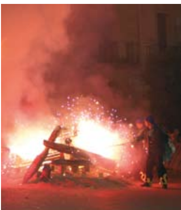
La Flama del Canigó arriba cada any puntual la nit de Sant Joan