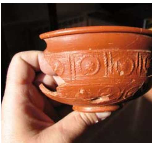
Bol de ceràmica de l'època romana.

Lloc: Museu de Sant Boi Organització: Ajuntament