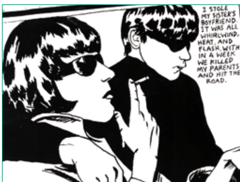
Imatge d'un disc dels Sonic Youth.

Lloc: Can Castells Centre d'Art Organització: Ajuntament