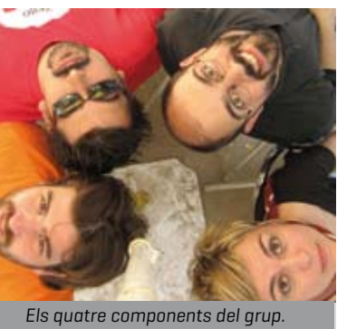
Els quatre components del grup.

DIVENDRES 12 DE FEBRER Lloc: Cal Ninyo | Preu de l'entrada: 5 € | Organització: Ajuntament