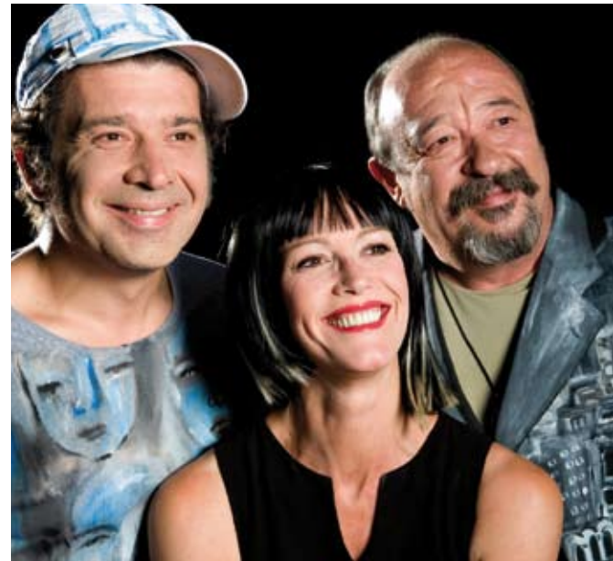
Els actors de Top Model.

DIUMENGE 21 DE FEBRER Espectacle: BoomBach | Lloc: Can Massallera | Preu de l'entrada: 12 €, normal i 9 €, reduïda | Organització: Ajuntament