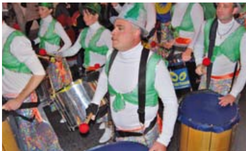
Un moment de la rua.

Lloc: Des de la plaça de Catalunya a la plaça de Teresa Valls i Diví Organització: Comissió Carnaboi i Ajuntament