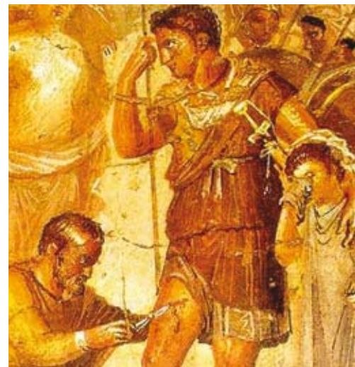
Exposició Ars Medica.

Lloc: Museu (Termes Romanes) Organització: Ajuntament