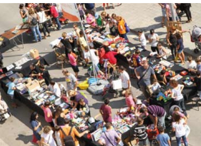
A la tardor, Sant Boi té cada anys una cita amb la solidaritat