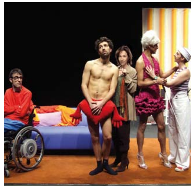
Els actors en un dels moments de la peça teatral

Diumenge 21 d'octubre Temporada de Teatre: El sexe dels àngels Hora: 19 h Lloc: Can Massallera Preu: 12 €, normal, i 9 €, reduïda. Venda anticipada a Telentrada i a la taquilla de Can Massallera Organització: Ajuntament