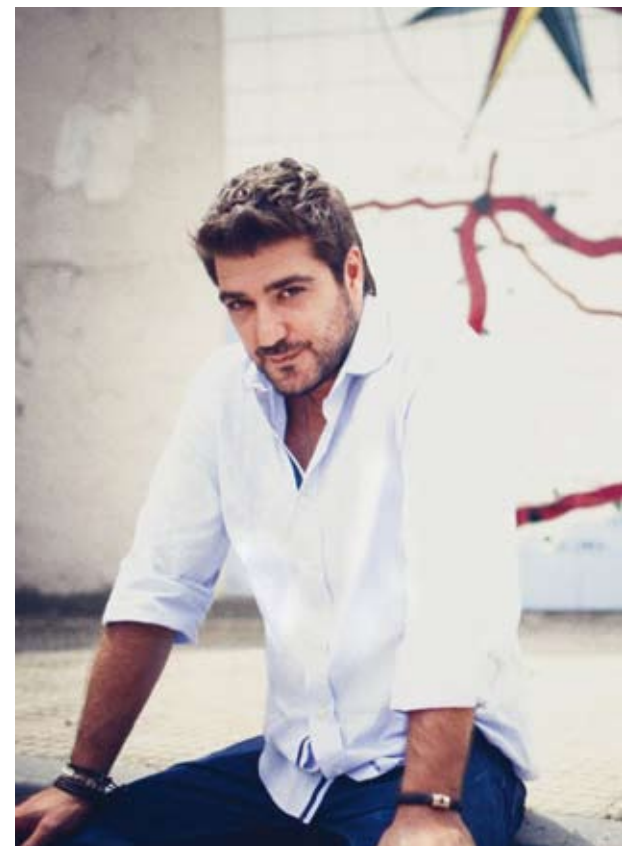
El cantant Antonio Orozco, en una foto promocional