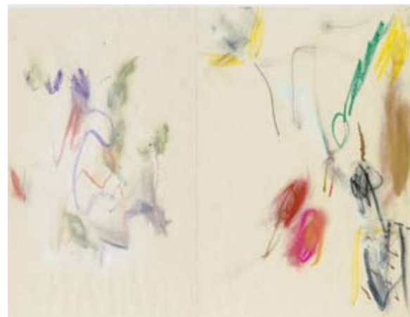
Dibuix d'Antoni Llena fet amb tècnica mixta sobre paper al setembre de 2010

http://cancastellscentredart.wordpress.com/