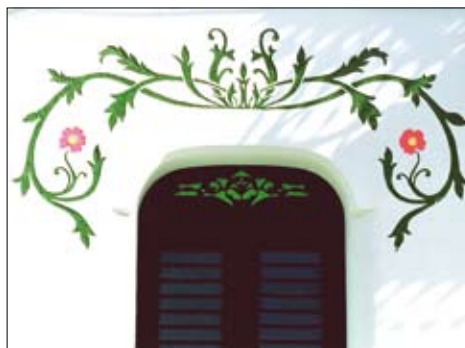
Detall d'una façana modernista del carrer de Pi i Margall

Punt de trobada: Museu Can Barraquer | Activitat gratuïta Organització: Ajuntament