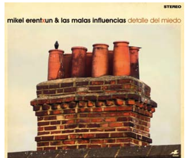
Caràtula del nou disc de Mikel Erentxun i Las malas Influencias