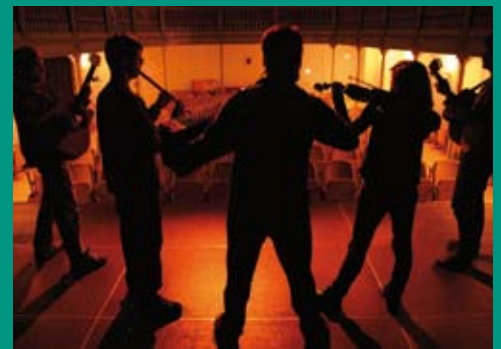
El grup Riu