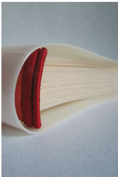
Un dels exemplars que presenta l'exposició

La locució llatina ex-libris significa literalment d'entre els llibres de i vol significar que un llibre, un volum en concret, és un objecte marcat, té un segell personal i és propietat d'algú que passa a ser-ne el lector i el posseïdor. D'aquesta manera aquell llibre se separa de la resta d'exemplars editats i es configura únic.