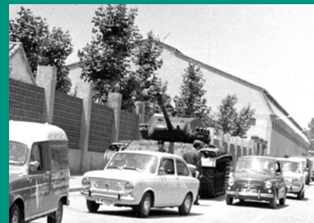
Una imatge de Sant Boi del 23 de gener de 1981