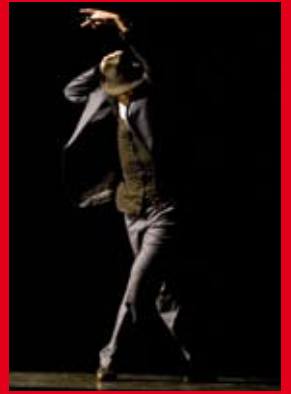
El ballarí dalt de l'escenari, en ple treball

Les persones interessades a participar a la classe del dia 30 s'han d'adreçar al telèfon 646 000 643 o al correu electrònic ccasb@hotmail.com