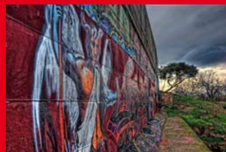
The wall, d'Alex Caballera, guanyador de l'any passat en la categoria de Sant Boi

La primera edició va comptar amb 69 participants i un total de 208 fotografies. El 50% van ser concursants de Sant Boi, un 20% d'altres punts de Catalunya i la resta de diversos indrets d'Espanya.