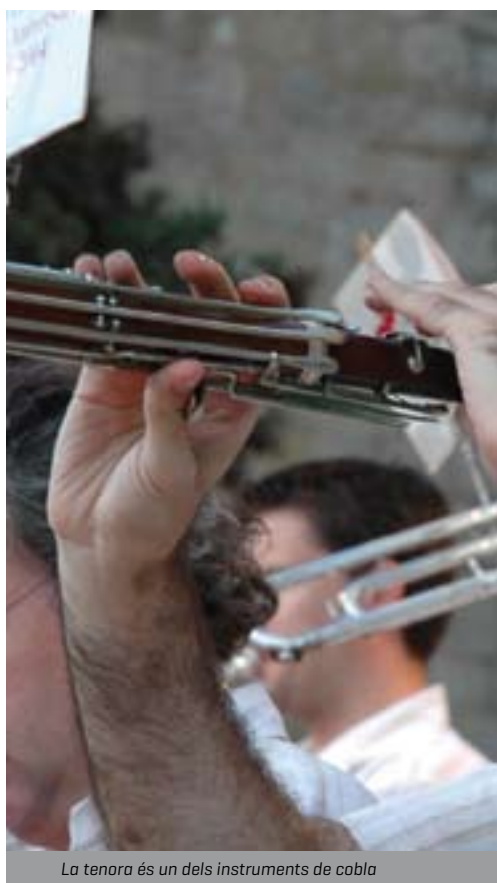
La tenora és un dels instruments de cobla