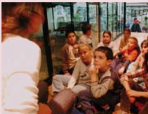
L'Hora del conte