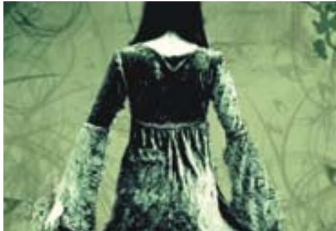
Fragment del cartell de la pel·lícula Policromia

20.15 h. Acte final de la 15a edició de Fem el Pessebre A Can Massallera Durant l'acte els autors rebran un obsequi personalitzat de record.