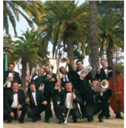
La Cobla Contemporània