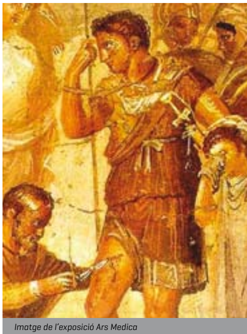
Imatge de l'exposició Ars Medica