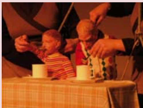
Escena de l'espectacle L'avi Ramon