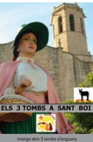
ELS 3 TOMBS A SANT BOI

ganitzadors destaquen el caràcter popular de l'esdeveniment. Enguany el recorregut anirà acompanyat d'una cercavila de gegants i grallers. L'activitat començarà a dos quarts de dotze a la plaça de l'Ajuntament i farà tres voltes per la rambla, els carrer de Pi i Margall i de Cervantes, la plaça del Cap de la Vila, els carrers de la Rutlla i Joan Bardina. En acabar, es beneiran els animals, tal com assenyala la tradició. Per raons tècniques, no podran participar els carros amb rodes de metall.