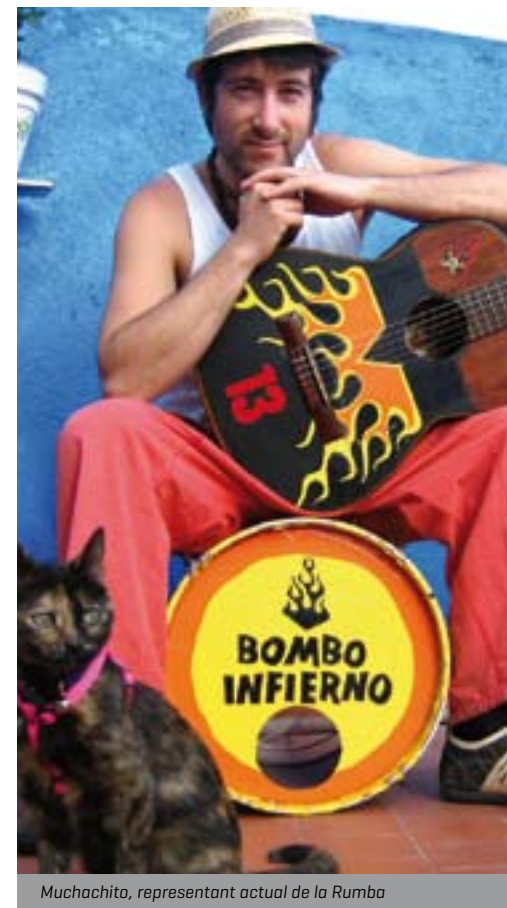
Muchachito, representant actual de la Rumba