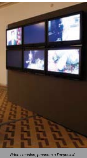
Vídeo i música, presents a l'exposició

de Pau Riba- amb episodis en què participen artistes conceptuals com Dan Graham, Joseph Beuys o Yves Klein, i arriba als nostres dies amb el treball d'artistes i músics.