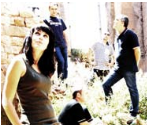
El grup Aston