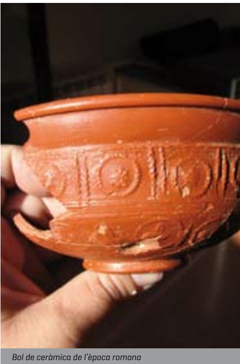
Bol de ceràmica de l'època romana