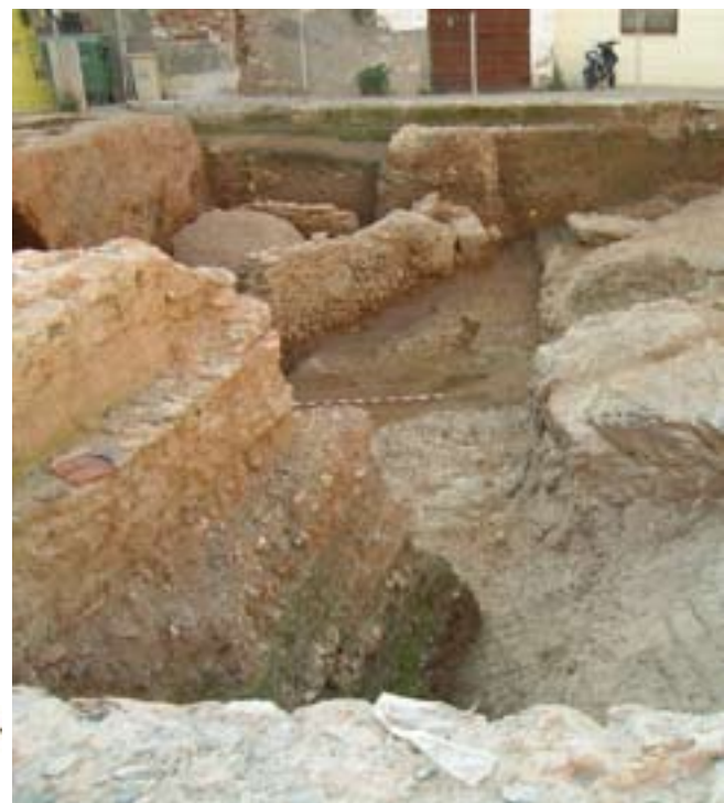
Excavacions a la plaça de la Constitució