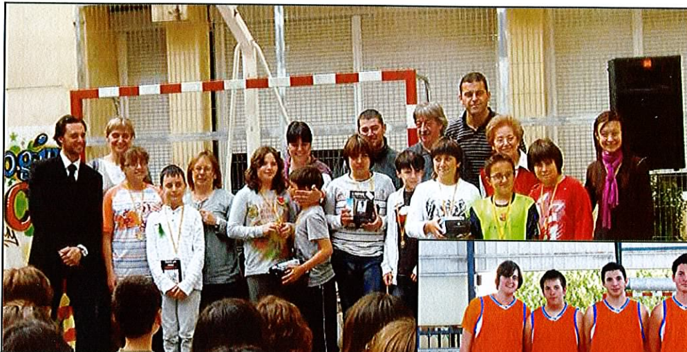
Guanyadors/es del Concurs literari "Somnis per contar"

EXEMPLAR GRATUÏT · Escola Pedagogium COS · 3a. Època / núm. 15