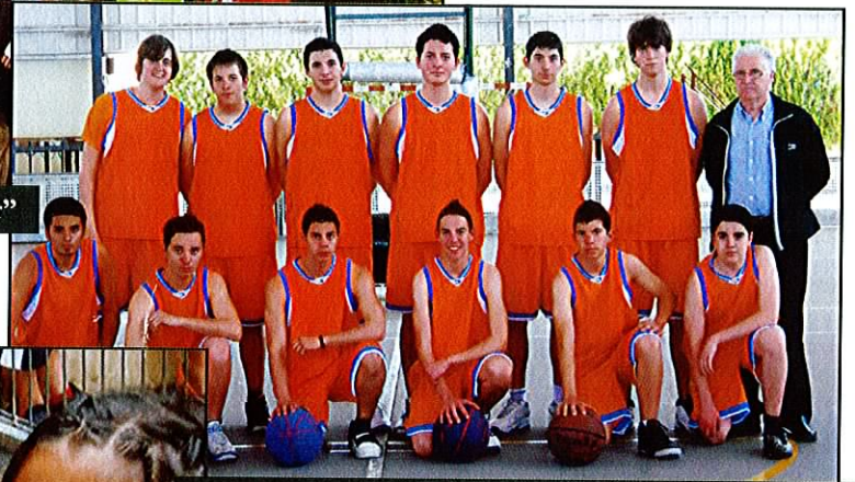
Equip de bàsquet finalista del Campionat de Catalunya