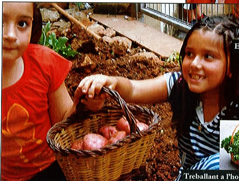
Treballant a l'hort de l'escola