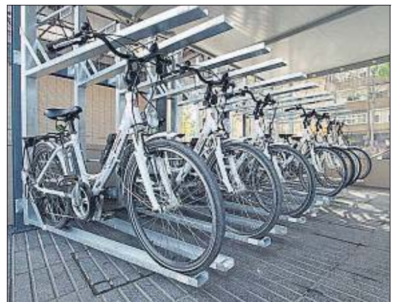
Bicicletes elèctriques utilitzades durant la prova pilot del pàrquing

LA POBLA DE MAFUMET ▶ El polígon petroquímic del sud de Tarragona disposarà de dos mesuradors nous per analitzar la qualitat de l'aire: un a la Canonja i un altre a la Pineda (Vila-seca). Aquests dos s'afegeixen als onze que actualment estan analitzant la presència de 89 compostos orgànics volàtils. El conseller Josep Rull va explicar ahir, després de la tercera reunió de la Taula de la Qualitat de l'Aire del Camp de Tarragona, que a proposta de la UPC, la URV i el CSIC es consensuarà la metodologia per fer els futurs estudis. / Sara Sans