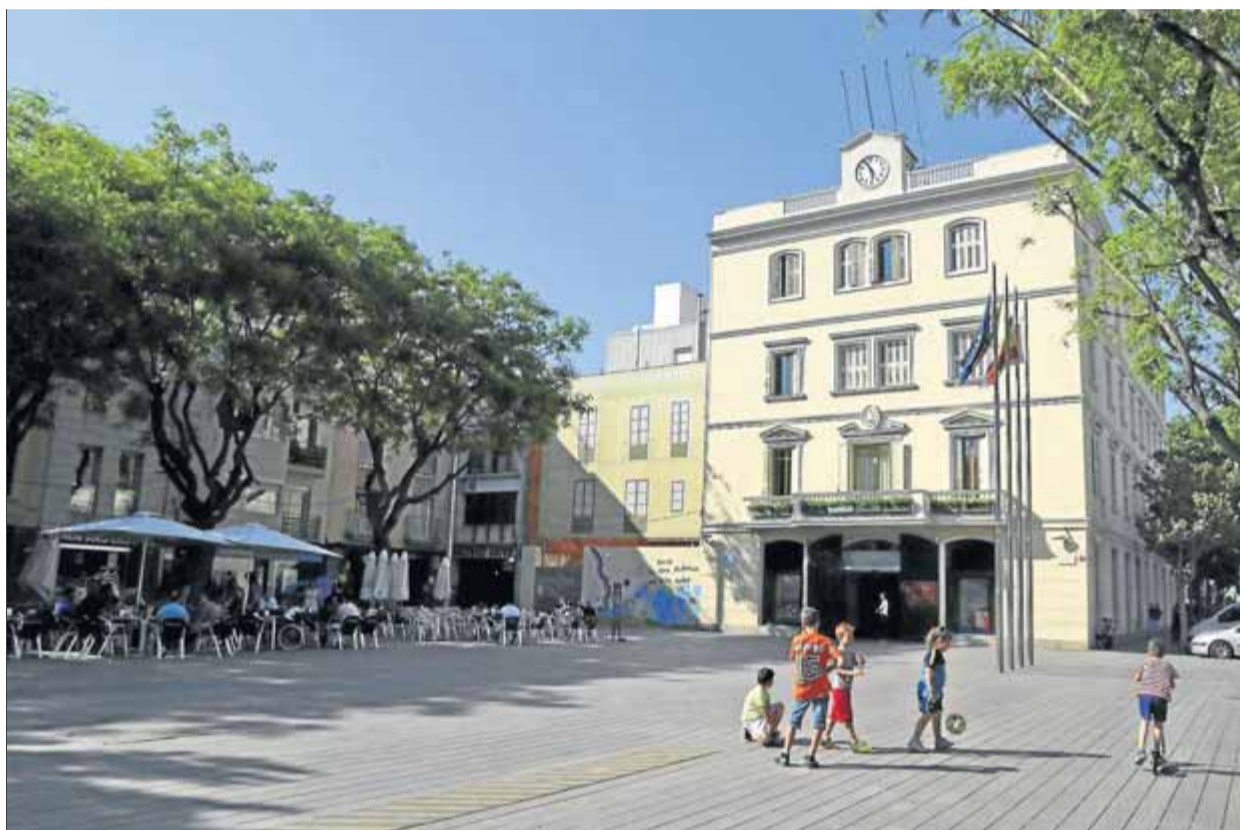
Un grup de nens jugant a la plaça de l'Ajuntament de Sant Boi de Llobregat

En relació amb el pla d'acció del govern, en els darrers dotze mesos l'equip municipal ha redoblat els esforços per fer de Sant Boi una ciutat referent de l'economia social, el cooperativisme i l'emprenedoria social del delta del Llobregat. A través d'instruments com ara el Coboï –un laboratori cívic d'ajuda i suport a l'emprenedor– s'han "identificat" iniciatives i projectes locals que abans eren invisibles i ara s'estan convertint en "activitats econòmiques reals que generen ocupació", explica