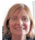
Lluïsa Moret (PSC) Alcaldesa de Sant Boi de Llobregat des del 2014