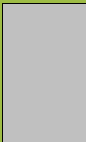
L'espectacular cedre centenari del Benviure té un gran valor científic

El cedre del Líban, emplaçat al col·legi Benviure, és un exemplar únic al Baix Llobregat per la seva edat (més de 100 anys), dimensions i excel·lent estat de conservació, però sobretot perquè pertany a una espècie gairebé extingida arreu. La cica que hi ha a prop