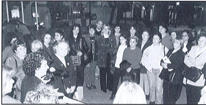
Lectura del manifest, a la plaça de l'Ajuntament

juny, semestre que s'ha valorat, ja s'han atès 117 casos, amb un total de 143 intervencions professionals. El projecte del