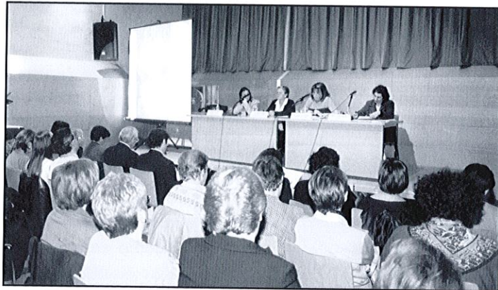
Taula rodona a Can Massallera

D'altra banda, a Sant Boi es van recollir unes targetes signades que la Coordinadora Ca La Dona va enviar a Nova York per tal de transmetre el seu suport.