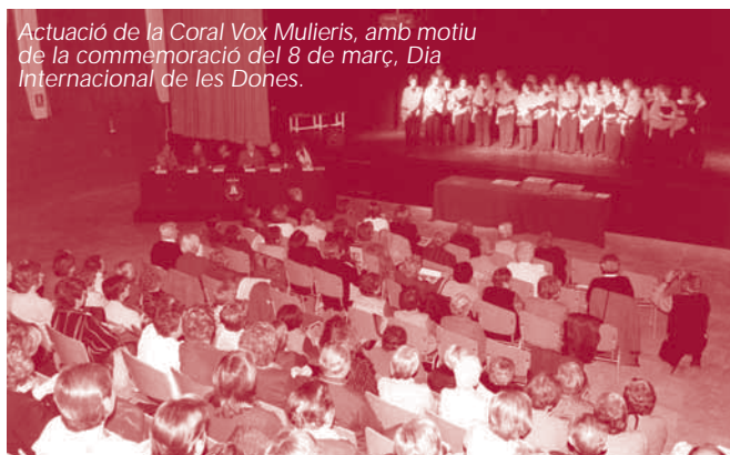
Actuació de la Coral Vox Mulieris, amb motiu de la commemoració del 8 de març, Dia Internacional de les Dones.