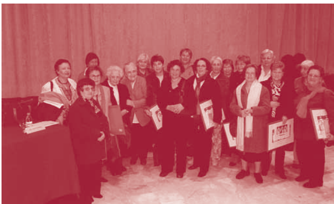
Les mestres homenatjades, junt amb l'alcaldesa.