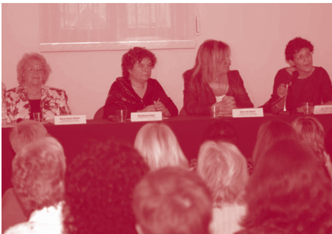
La fil sofa Fina Birul s va fer una confer ncia a Sant Boi el passat mes de mar , en el marc de la celebraci del 2n Congr s de les Dones del Baix Llobregat

La resposta a totes aquestes qüestions és negativa. Les dones estan preparades per fer carrera política igual que els seus companys però, en canvi, les xifres de representació política dels municipis i governs en general, ens mostren que hi ha moltes menys dones que homes assolint regidories, per no parlar d'alcaldies o presidències de comunitats autònomes i/o governs. A més, hem de destacar que les dones que aposten per la carrera política moltes vegades l'abandonen, per decisió personal o del propi partit, durant la primera o la segona legislatura, mentre que els homes assoleixen la carrera política com una carrera professional que pot durar tota la vida. A què és degut aquest fenomen? La conciliació de la vida personal i la laboral té molt a veure amb la dedicació de les dones a la política com ens mostren les xifres de fills i filles que tenen els i les ministres del govern paritari espanyol; però també s'ha de fer esment a què la política ha estat i està molt masculinitzada, i que moltes vegades les dones que formen part dels governs defineixen com a "companyes" les dones no només del seu partit sinó també de l'oposició mentre que se solen sentir soles entre els homes de la seva organització.