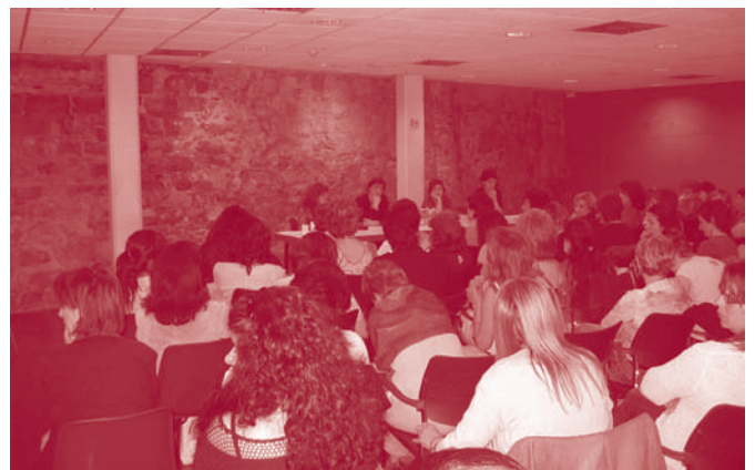
Foto de la taula rodona del Seminari de Primavera

Les dones cada vegada tenen més interès per conèixer i decidir sobre els parts i els seus cossos