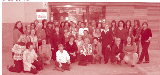
Les participants a l'acte sobre Dona i lideratge celebrat a Can Jordana el 25 de març