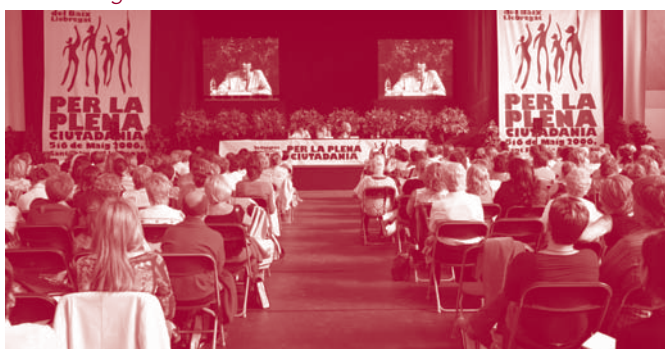
Soledad Murillo, Secretaria General de Polítiques de Igualtat, del Ministerio de Trabajo y Asuntos Sociales, va fer la conferència inaugural del 2n Congrés