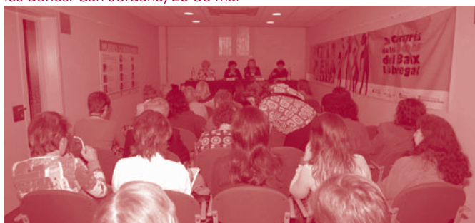
Sant Boi, subseu del Congrés. Sessió per tractar sobre el lideratge de les dones. Can Jordana, 25 de març