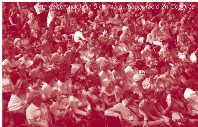
Vista general del dia 5 de maig, inauguració 2n Congrés

Sant Boi, junt amb Cornellà i Sant Feliu, és un dels municipis de la comarca que més polítiques i recursos