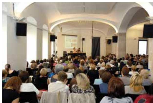
Una imatge de la trobada