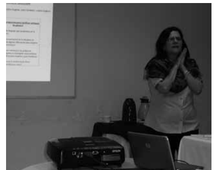
Seminari d'Escazú, Costa Rica. Agost de 2010

El seminari estarà obert a la ciutadania i donarà l'oportunitat de conèixer diverses experiències per millorar la nostra capacitat de promoure una ciutat més segura, equitativa i cohesionada. ■