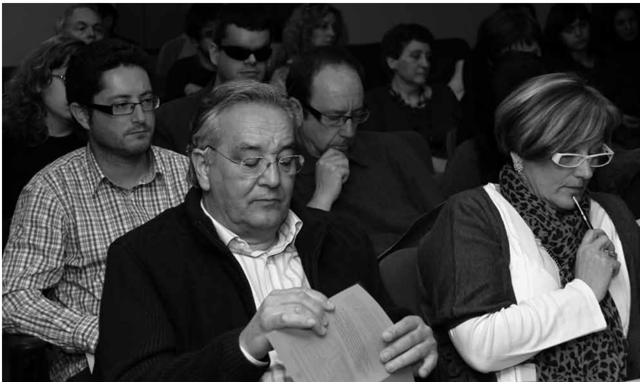
Públic assistent a la presentació el passat dia 8 de febrer.

L'ús del temps quotidià està condicionat per la diversitat d'activitats que realitzem al llarg de la jornada. Per això, només des del plantejament d'una actuació coordinada en els diferents àmbits – transports, accessibilitat, serveis i equipaments, horaris comercials i laborals, etc. – és possible impulsar una veritable transformació. El resultat és el Pacte per a l'Ús del Temps a la Ciutat , un pla d'acció que implica a tots els agents econòmics i socials en l'objectiu comú de millorar la gestió del temps dels ciutadans i ciutadanes de Sant Boi. ■