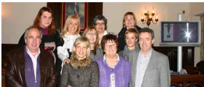
Representants dels Ajuntaments convocants de la VI edició del Premi Delta.

El termini de presentació de les obres finalitzarà improrrogablement a les