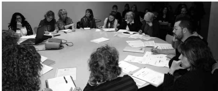
Reunió de treball del Consell de les Dones del Baix Llobregat