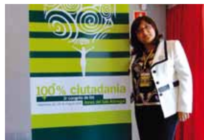
Salán al 3r Congrés de les Dones del Baix Llobregat celebrat el mes de maig del 2010 a Viladecans.