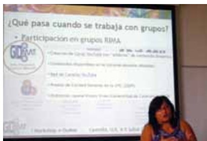
A la UJI (Castelló), en una Jornada d'Innovació Docent en l'àmbit de Materials, on va estar convidada a fer la Conferència Plenària.